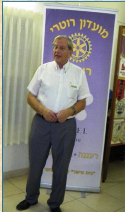
פסוק השבוע נ"ל פנחס מלכיאור